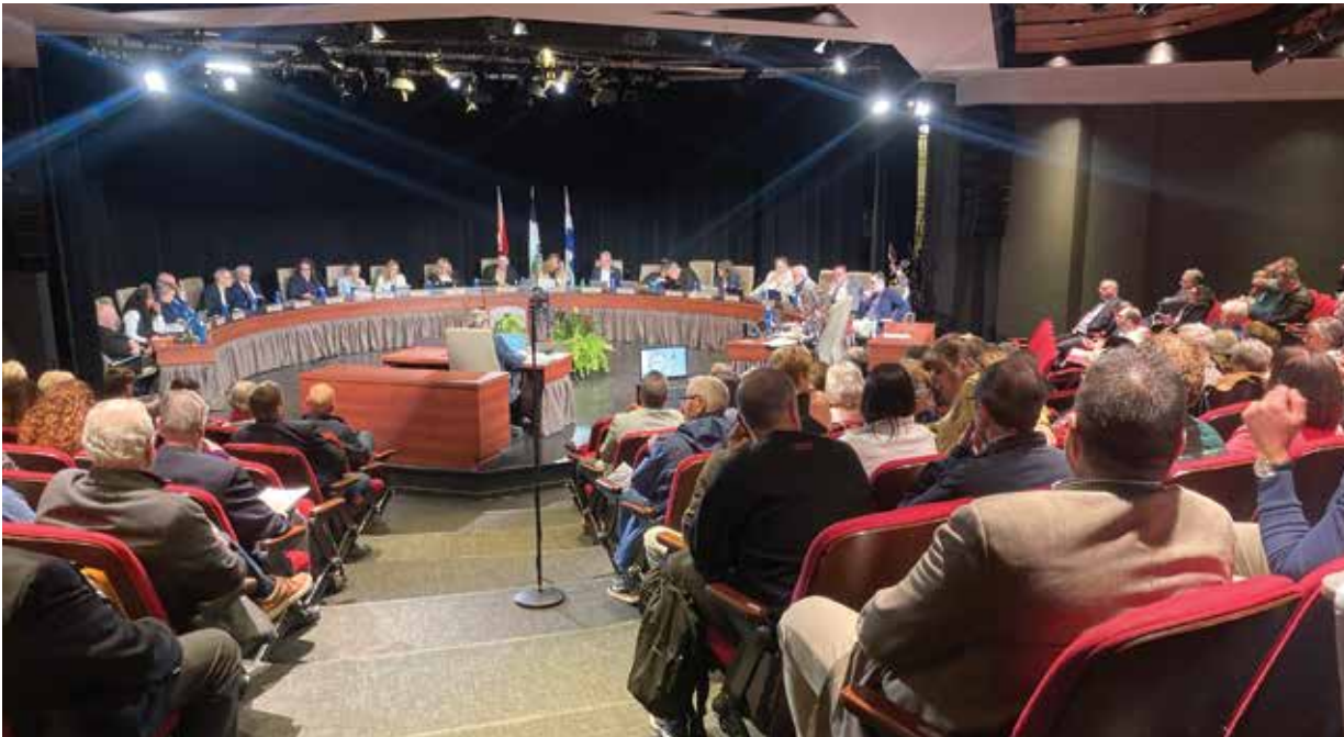
Around 200 people from across the city packed the auditorium at the Salle Jean-Desprez in Hull for the monthly Council meeting. (JDP)